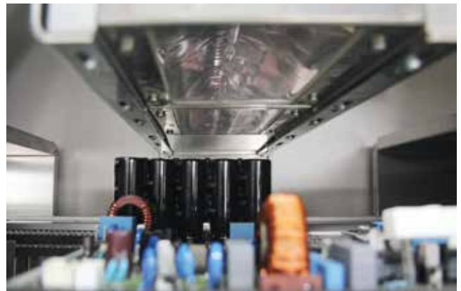
Leistungsstarke Strahler im RDS UV für die Trocknung aller UV-aushärtenden Lacke