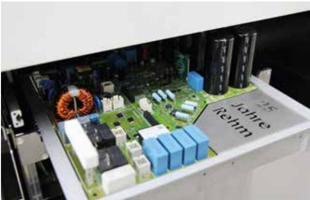
Problemlose Verarbeitung von Boards mit sehr großen Bauteilhöhen

Standardmäßig ist der RDS UV mit einem Stiftekettentransport ausgestattet. Unabhängig von der Leiterplattegeometrie lässt sich das Transportsystem optimal an Ihre Baugruppe anpassen. Transportspuren und -geschwindigkeit sind flexibel einstellbar.