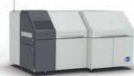
Condenso | Kondensationslöten