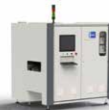
RDS | Trocknen