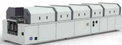
VisionX | Konvektionslöten