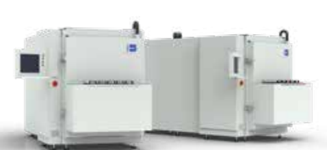
Securo | Funktionstest