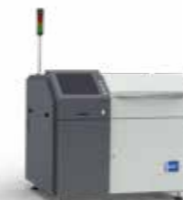
Nexus | Kontaktlöten