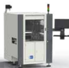
Protecto | Coating